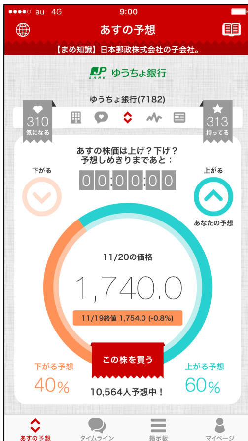
1日の予想数が10,000を突破

今後とも、あすかぶ!は株初心者から株のエキスパートまで多くのユーザーを集め、株を切り口に良質なコンテンツの集まるプラットフォームにしていまいります。